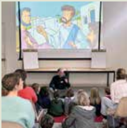
Foi en famille.

Chorale d'enfants à Saint-Pierre (dès 7 ans)