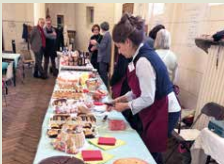
Journées d'amitié 2024.